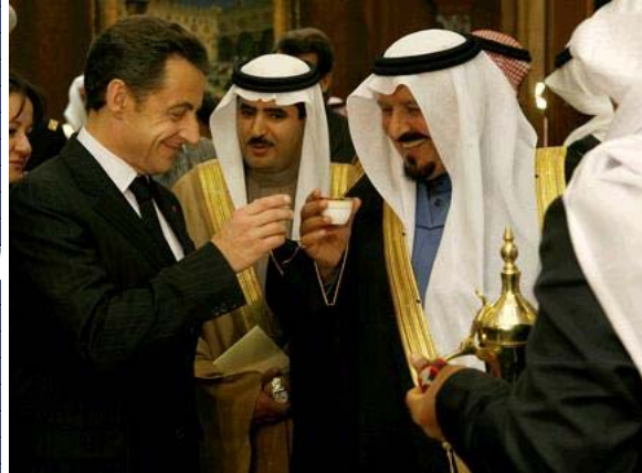
Mondialisation.ca, Le 21 mars 2012

Envoyer cet article à un(e) ami(e) Imprimer cet article