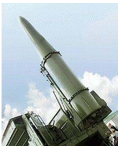
Missile mobile Iskander

Si c'était un mariage, les motifs d'un divorce seraient réunis.