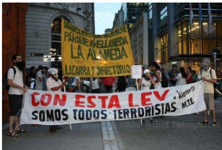
«Avec cette loi, nous sommes tous des terroristes», Manifestation contre la loi antiterroriste.

Le GAFI (Groupe d'Action financière) a, le 17 février dernier, félicité l'Argentine pour les avancées faites en matière de lutte contre le blanchiment d'argent et le financement du terrorisme. Or la dite loi a suscité la polémique depuis plusieurs mois dans le pays.