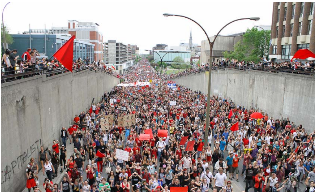
Manifestation du 22 mai.

Cette loi spéciale a fait sortir des centaines de milliers de manifestants dans les rues de la métropole le 22 mai, en plein après-midi, et a donné naissance à de longs et bruyants concerts quotidiens de casseroles qui prennent de l'ampleur jour après jour défiant la nouvelle loi spéciale. Plutôt que de faire taire le mouvement étudiant par la force, la loi spéciale lui a donné un second souffle et l'a même transformé en lutte populaire touchant à divers enjeux.