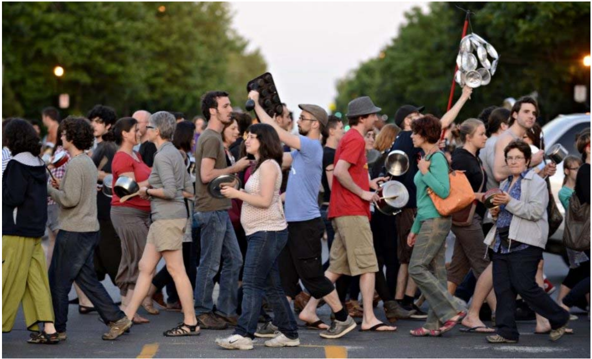
Manifestation de casseroles 23 mai.

La frustration accumulée envers ce gouvernement était un baril de poudre. En adoptant une loi injuste envers et contre tous, il y a mis le feu et s'est mis la corde au cou. La désobéissance civile est totale. Les arrestations massives n'ont eu aucun effet sur l'enthousiasme des manifestants. Au contraire : en une seule soirée, dans la nuit du 23 au 24 mai, plus de 500 arrestations ont eu lieu dans la métropole, Montréal, et près de 200 dans la capitale, Québec. Le lendemain les citoyens de Montréal étaient encore plus nombreux à se mobiliser au son des casseroles et le mouvement s'est même propagé dans plusieurs autres villes de la province.