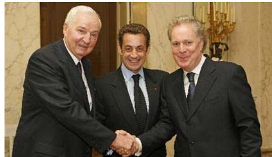
Paul Desmarais, fait grand-croix de la Légion d'honneur en 2008, en compagnie du président français Nicolas Sarkozy et du premier ministre du Québec Jean Charest.