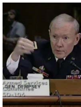
Leon Panetta et le Général US Martin Dempsey

Dans sa grande majorité, la couverture médiatique des auditions de mercredi s'est concentrée sur l'intervention empreinte de chauvinisme du sénateur McCain, l'ex-candidat républicain aux présidentielles. Il exige que les USA lancent des frappes aériennes contre la Syrie, pour aménager des « zones sécurisées » dans lesquelles les groupes armés soutenus par l'Occident pourront préparer des offensives militaires contre le gouvernement du président syrien Bachar al-Assad.