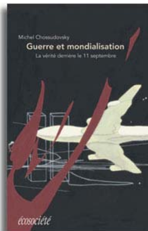
Guerre et mondialisation