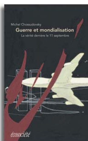
Guerre et mondialisation