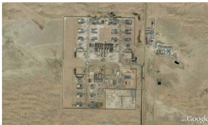
Vue satellitaire de la base d'entraînement en construction de Xe aux Emirats.

À Zayed Military City, un camp d'entraînement dans une zone désertique des Émirats arabes unis, est en train de naître une armée secrète qui sera utilisée non seulement à l'intérieur du territoire mais aussi dans d'autres pays du Proche-Orient et de l'Afrique du Nord. C'est Erick Prince qui est en train de la mettre sur pied : un ex commando des Navy Seals qui avait fondé en 1997 la société Blackwater, la plus grande compagnie militaire privée utilisée par le Pentagone en Irak, Afghanistan et autres zones de guerre. La compagnie, qui en 2009 a été renommée Xe Services, (afin, entre autres motifs, d'échapper aux actions juridiques pour les massacres de civils en Irak) dispose aux États-Unis d'un grand camp d'entraînement où elle a formé plus de 50 000 spécialistes de la guerre et de la répression. Et elle est en train d'en ouvrir d'autres.