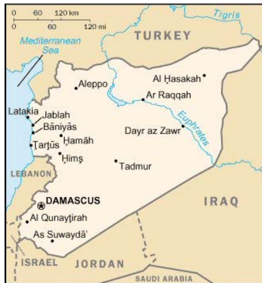
Carte de la Syrie et des pays avoisinants