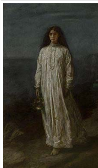
La somnambule de John Everett Millais

L'administration des pilules pour dormir Ambien, le produit pharmaceutique le plus populaire de sa catégorie dans le pays nord-américain, peut produire du somnambulisme, mais le plus alarmant est que dans cet état, les gens peuvent, sans s'en rendre compte de ce qu'ils font, conduire une voiture, parler au téléphone, avoir des relations sexuelles et – le plus terrible- commettre des assassinats selon une enquête menée par le portail The Fix . [1]