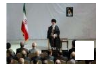
"L'Islam appelle tout le monde à respecter les ouvriers" (Guide suprême) (vidéo)