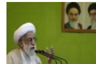
L'instabilité en Ukraine est au détriment de son peuple (Prédicateur de la prière du vendredi à