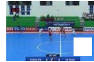
Equipe de football en salle iranien, première en Asie (vidéo)