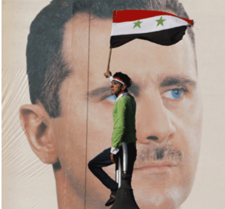
Mondialisation.ca, Le 7 aout 2012 tayyar.org

Envoyer cet article à un(e) ami(e) Imprimer cet article