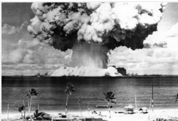
An atom bomb test explodes in Bikini Atoll.