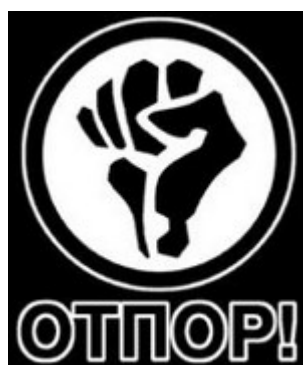
Logo original d'OTPOR

Plusieurs mouvements ont été mis en place pour conduire les révoltes colorées. Parmi eux, OTPOR (Résistance en serbe) est celui qui a causé la chute du régime serbe de Slobodan Milosevic. Le logo d'OTPOR, un poing fermé, a été repris par tous les mouvements subséquents, ce qui suggère la forte collaboration entre eux.