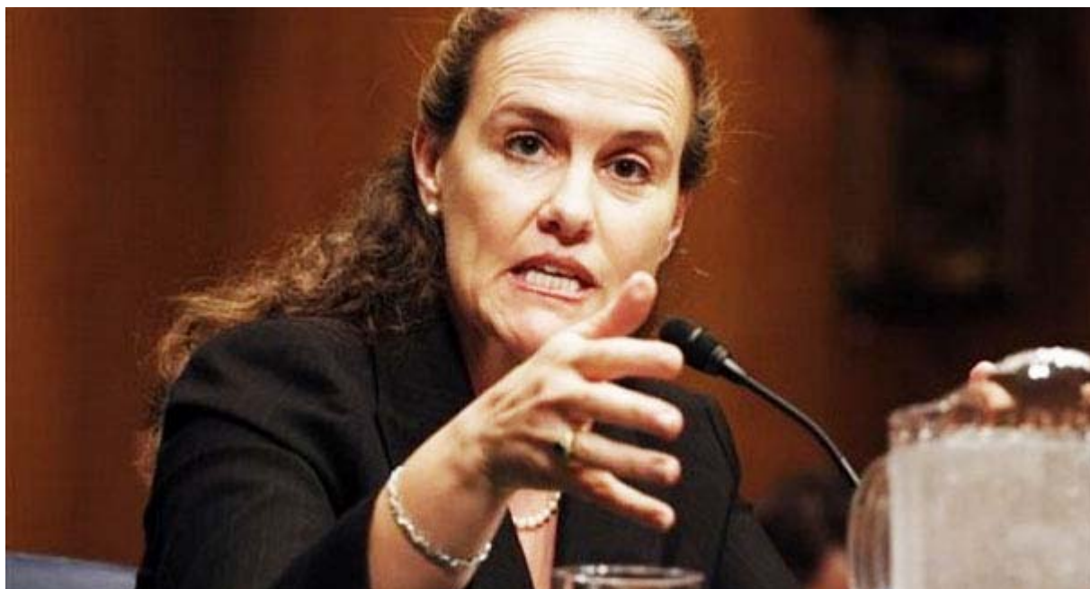
Michèle Angélique Flournoy, pressentie comme 4ème secrétaire à la Défense

« Après s'être comporté comme un béni oui-oui durant sa première année dans l'administration, il avait commencé à s'opposer à la politique de défense du Président », a aussi déclaré à The Daily Beast le conseiller d'un sénateur républicain qui s'opposait à la nomination de Hagel.