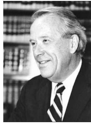
Henry Scoop Jackson (1912-1983)

Jackson, partisan de la guerre du Vietnam et opposé à toute idée de détente, concurrent de McGovern aux primaires de 1972. Richard Perle rédige l'amendement Jackson-Vanik, qui conditionne l'aide alimentaire à l'URSS à la libre émigration des juifs. C'est aussi au sein du bureau de Scoop Jackson que se forge l'alliance entre les néoconservateurs et le tandem Rumsfeld-Cheney, qui profite de la brèche du Watergate pour rejoindre le camp