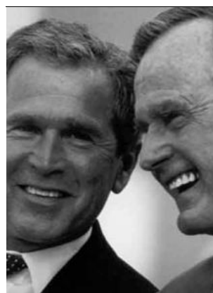
Andrew Cockburn rapporte dans son livre sur Rumsfeld (2007) cette conversation entre les deux George Bush : — Qu'est-ce qu'un néocon ?

Dans un article du Wall Street Journal du 20 novembre 2001, le néoconservateur Eliot Cohen parle de la guerre contre le terrorisme comme « la IVe Guerre mondiale », et le terme sera repris par d'autres néoconservateurs. En septembre 2004, un colloque néoconservateur à Washington incluant Norman Podhoretz et Paul Wolfowitz s'intitulait « IVe Guerre mondiale : Pourquoi nous battons–nous, qui pouvons–nous combattre, comment nous nous battons » [114]. Cohen y déclarait : « L'ennemi, ce n'est pas le terrorisme [...] mais