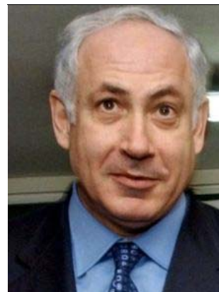
Interrogé au lendemain du 11-Septembre sur ses conséquences dans les relations entre les États-Unis et Israël, Benjamin Netanyahu

De surcroît, il faut que les États-uniens croient que ces ennemis détestent leur pays pour ce qu'il incarne (la démocratie, la liberté, etc.), et non en raison de son soutien à Israël, alors que telle est bien en réalité la principale cause du ressentiment contre les États-unis dans le monde musulman. Les signataires d'une lettre du PNAC adressée au président Bush le 3 avril 2002 (incluant William Kristol, Richard Perle, Daniel Pipes, Norman Podhoretz, Robert Kagan, James Woolsey) iront