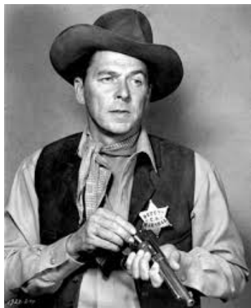
Ronald Reagan dans Law and Order 1953

On ne peut pas traduire Deep State mot à mot. Dans ce contexte, État profond ne va pas au fond des choses. Il s'agit, dans le cadre de la guerre froide, des cellules stay-behind [arrière-garde, NdT], c'est à dire des réseaux clandestins coordonnés par l'OTAN [réseau Gladio, voir ci-dessous] et implantés dans seize pays d'Europe de l'Ouest par les services secrets américains et britanniques après la Deuxième Guerre mondiale. Grâce à leurs contacts avec la pègre et les gens du milieu, disposant de caches d'armes et de munitions importantes, ces cellules visaient à combattre une éventuelle occupation par le bloc de l'Est en se tenant prêtes à être activées en cas d'invasion par les forces du Pacte de Varsovie. La plus célèbre de ces cellules, et la première à avoir fait l'objet de révélations, est le réseau italien Gladio . Effectivement c'est la racine du mal, ce terrorisme exporté par l'empire anglo-sioniste et ses vassaux européens – sans foi, ni loi.