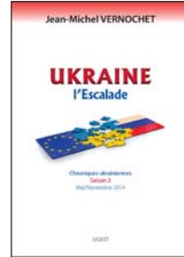
Commander ici (http://edsigest.blogspot.fr/2014/11/ukraine-lescalade.html)

S'inscrire à notre lettre d'information. Courriel [input] Envoyer [button] (http://arretsurlinfo.ch/tous-les-articles) (https://twitter.com/ArretSurInfo) (https://www.facebook.com/pages/ArretSurInfo/300831053432742) (https://www.youtube.com/channel/UCgxD41wz8ansP3-HlDQ)