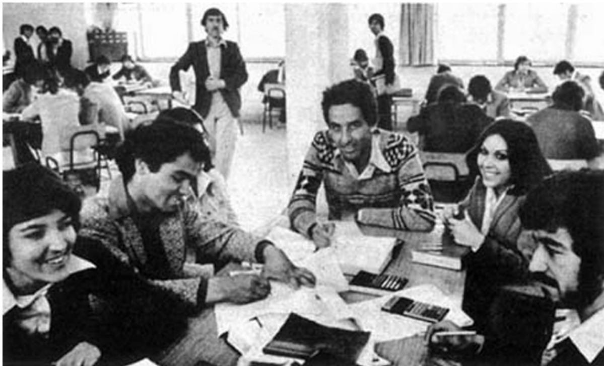
Université de Kaboul dans les années 1980

Dans les années 1980, Kaboul était « une ville cosmopolite. Les artistes et les hippies inondaient la capitale. Les femmes étudiaient l'agriculture, l'ingénierie et le commerce à l'université de la ville, elles occupaient des postes dans la fonction publique. » Il y avait des femmes députés, elles conduisaient des voitures, voyageaient et fréquentaient des hommes sans avoir à demander la permission à un gardien.