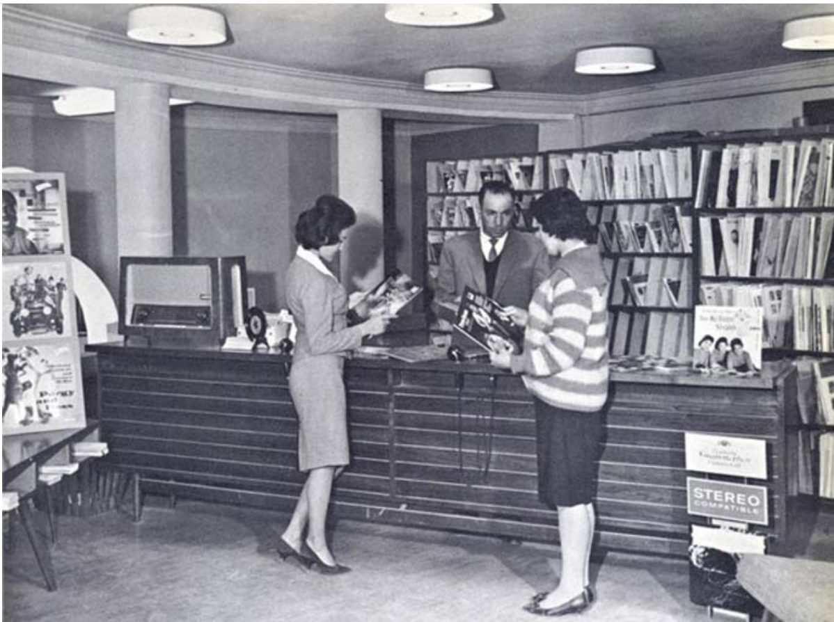
Magasin de disques

Dans les années 1950s and 1960, les femmes pouvaient poursuivre des carrières professionnelles dans des domaines comme la médecine. Aujourd'hui, les écoles éduquant les femmes sont la cible de violences, encore plus aujourd'hui qu'il y a cinq ou six ans.