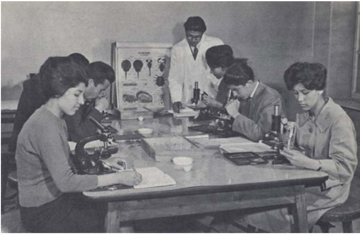
Classe de Biologie, Université de Kaboul

Dans les années 1950s and 1960, les femmes pouvaient poursuivre des carrières professionnelles dans des domaines comme la médecine. Aujourd'hui, les écoles éduquant les femmes sont la cible de violences, encore plus aujourd'hui qu'il y a cinq ou six ans.