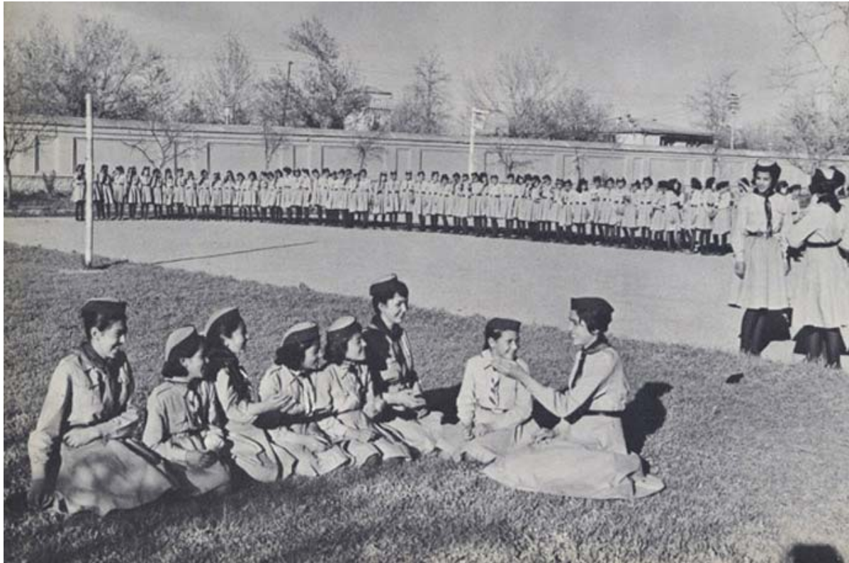
Des centaines de jeunes Afghans participent activement à un programme de scoutisme

Il y avait également des magasins de musique, apportant aux adolescents de Kaboul le rythme et l'énergie du monde occidental.