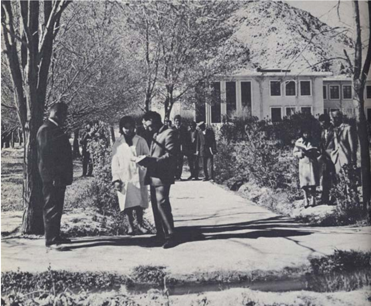
Les étudiants de Kaboul changeant de classe. Les inscriptions ont doublé dans les quatre dernières années

« Le campus de l'Université de Kaboul ci-dessus n'a pas beaucoup changé contrairement aux gens. Dans les années 1950 et 1960, les étudiants portaient des vêtements de style occidental et les jeunes hommes et femmes se côtoyaient assez librement. De nos jours, les femmes couvrent leur tête et la majorité de leur corps, même à Kaboul. Un demi-siècle plus tard, les hommes et les femmes vivent dans des univers bien plus séparés.