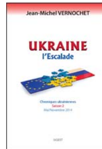
Commander ici ( http://edsgest.blogspot.fr/2014/11/ukraine-lescalade.html )