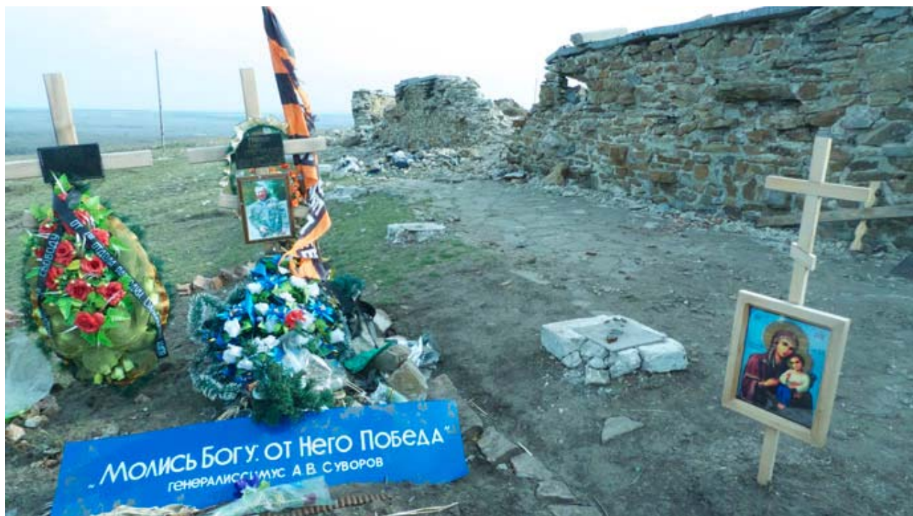
Enterrement : un héros de la République Populaire de Donetsk à Saur-mogila.

Deki montre une vidéo absolument poignante de la victoire de la République populaire à l'aéroport de Donetsk maintenant totalement en ruines, tournée à partir de son téléphone mobile. La scène principale (qui n'est pas reprise intégralement sur Youtube) commence par montrer des soldats qui rient, bavardent et fument, puis fait un panoramique montrant des dizaines de corps inanimés et éparés de soldats des forces armées de Kiev.