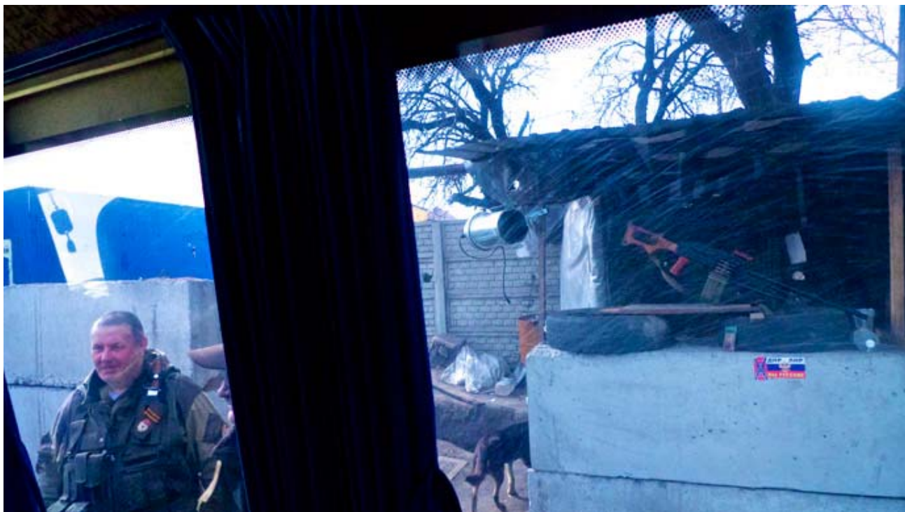
Barrage de contrôle à Donetsk

Après Odessa, disent-ils, en référence au massacre de civils qui s'y est déroulé en mai dernier, l'Ukraine telle que nous la connaissons a cessé d'exister. Quelle serait alors la meilleure solution pour le Donbass ? Leur priorité est de libérer tous les Ukrainiens du fascisme. Après la victoire, des référendums devraient être tenus dans toutes les régions du pays. Les gens devraient voter pour ce qu'ils veulent ; que ce soit demeurer en Ukraine, se rapprocher de l'Europe ou encore de la Russie. Ce qui suppose une progression vers l'ouest de l'Ukraine, en territoire hostile. Nous sommes prêts à cinq, sept ans de guerre, peu importe.