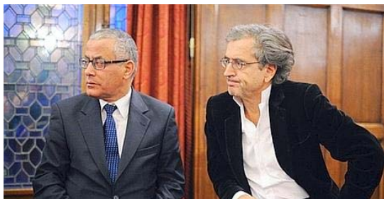
Ali Zeidan et Bernard-Henri Lévy, le 22 mars 2011 à l'hôtel Raphaël (Paris)

Pour l'anecdote, rappelons qu'Ali Zeidan, un des « copains » du « grand révolutionnaire » Bernard-Henri Lévy, a été Premier ministre de la Libye (2012 – 2014) avant de s'envoler vers l'Allemagne en mars 2014, fuyant le pays pour sauver sa peau [11].