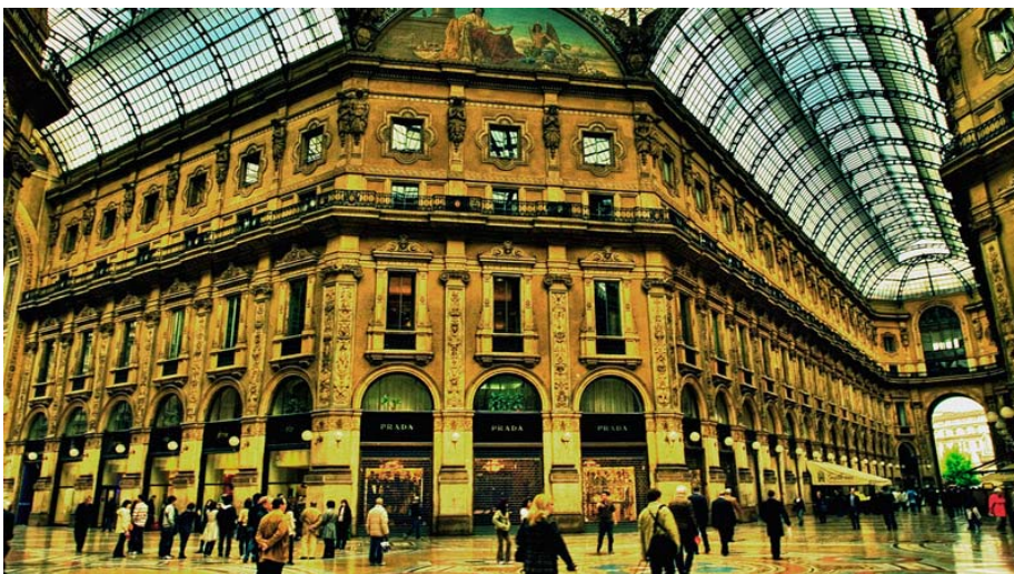
( http://arretsurinfo.ch/wp-content/uploads/2015/05/milan.jpg )