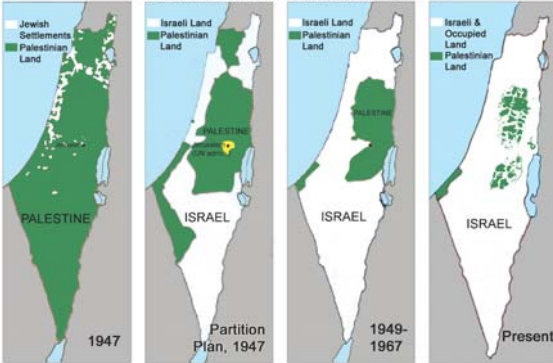
Palestinian Loss of Land 1947 to Present

(http://arretsurlinfo.ch/wp-content/uploads/2015/06/carte-palestine.png)