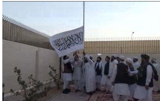
Inauguration de la Représentation permanente de l'Émirat islamique d'Afghanistan à Doha. Lever du drapeau dans le jardin de la Représentation.