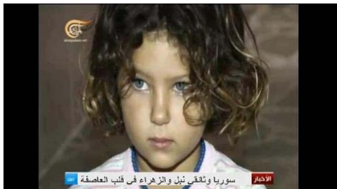
Fillette otage de la "révolution" d'Al Qaïda en Syrie

Depuis 10 mois déjà, Nubbol et Zahra, deux villages situés au Nord d'Alep sont assiégés par les rebelles djihadistes. Les 60.000 habitants de ces deux villages sont « coupables » d'être chiïtes.