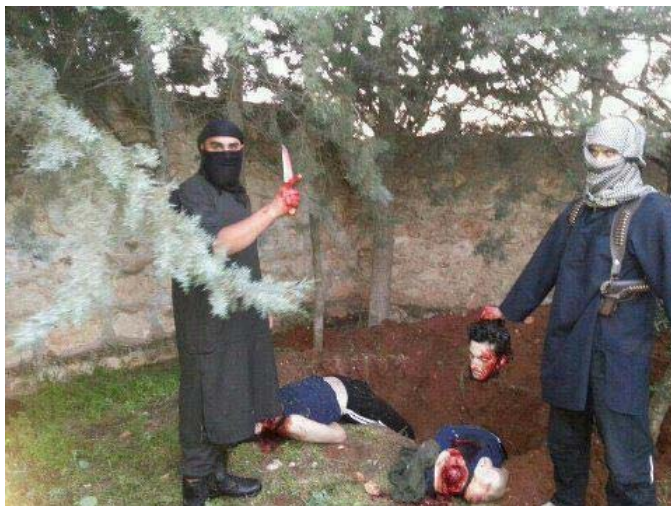
Rebelles du Front Al Nosra.