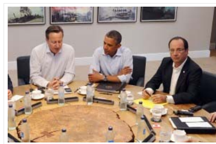
Photo : David Cameron, Barack Obama, François Hollande

Le visage que l'Occident présente au monde est celui d'un menteur impudent.