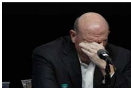
Indian Online Gaming CEO Fired After 46 Million Rupee Mistake Today Posts