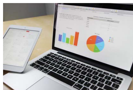
Performance Is King: Join The World's Leading Native Ad Network- Revcontent Revcontent