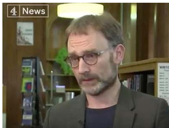
Le professeur Neil Ferguson, grand-prêtre de la gestion libérale des hôpitaux et inventeur du confinement généralisé contre le Covid-19.

عربي ESPAÑOL ITALIANO NEDERLANDS РУССКИЙ TÜRKÇE