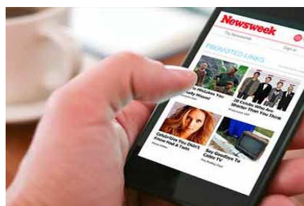
With Ads In Place, Google Takes Training Wheels Off AMP Adexchanger