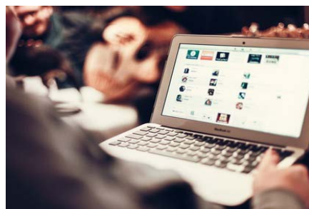
Join Revcontent: The World's Fastest Growing Native Ad Network Revcontent