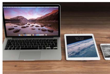
Get Premium Traffic Across All Devices with Revcontent Revcontent