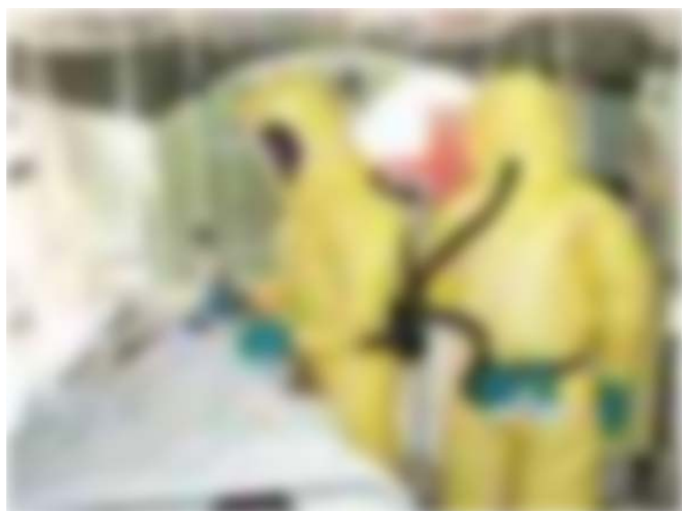
Une station de prise en charge de malades d'Ebola.