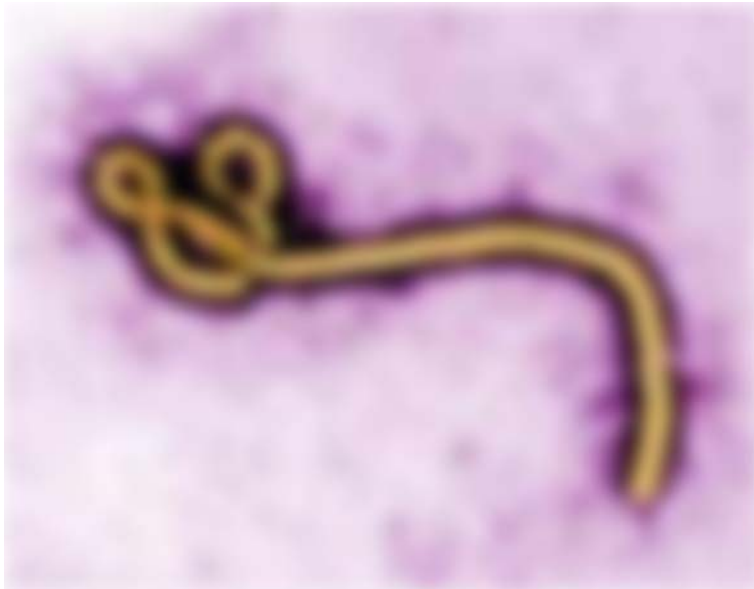
Le virus Ebola.

Les pratiques du laboratoire Gilead ont déjà été dénoncées sur ses médicaments contre l'hépatite C, vendus à plusieurs dizaines de milliers d'euros le traitement - une seule pilule est par exemple facturée plus de 600 euros l'unité (voir nos articles ici ( https://www.bastamag.net/Un-laboratoire-pharmaceutique-veut ) et ici ( https://www.bastamag.net/prix-medicaments-remboursement-securite-sociale-laboratoires-pharmaceutiques-anti-cancereux )). Résultat : ils sont inaccessibles pour de nombreux malades, et pèsent sur les comptes des assurances maladie dans les pays où un tel système existe.