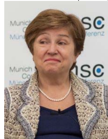
Joint Press Conference on Covid-19 by IMF Managing Director and World Bank Group President Washington, D.C. March 4, 2020

« Nous vous prêterons l'argent et avec l'argent que nous vous prêterons, vous nous rembourserez » (paraphrase).