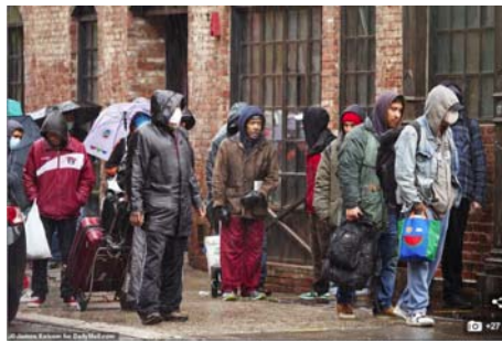
Long lines continued to form outside food banks and unemployment offices in dozens of cities over the weekend as the coronavirus pandemic takes a heavy toll on families, leaving many unsure of when their next paycheck will come. Pictured: Hundreds of people wait to receive meals at the Bowery Mission in New York City on Monday

« Des files d'attente de plusieurs kilomètres se sont formées dans les banques alimentaires et les bureaux de chômage à travers les États-Unis au cours de la semaine dernière ».