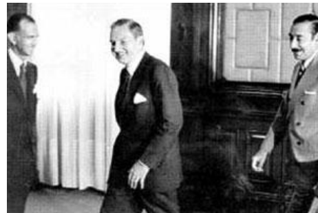
Image à droite : Le président général Jorge Videla, David Rockefeller et le ministre argentin de l'économie Martínez de Hoz, Buenos Aires (années 1970)