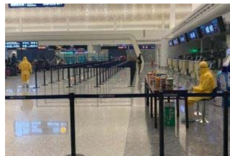
Image : Aéroport de Hong Kong. Vide

L'argent qu'ils se sont approprié au cours de la crise financière (par le biais d'une manipulation pure et simple) sera utilisé pour racheter des sociétés et des gouvernements en faillite.