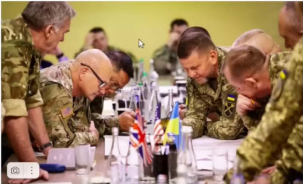
Ukrainian, American and British military leaders during a meeting in Ukraine in August 2023. Valerii Zaluzhnyi

En 2014, les États-Unis ont renversé le gouvernement élu de l'Ukraine. Ils ont mis en place un régime qui leur était fidèle. Selon le New York Times , la CIA a pris le contrôle de tous les services de renseignement ukrainiens. Nous rappelons que les États-Unis, en collaboration avec l'OTAN, ont restructuré et formé l'armée ukrainienne de 2014 à 2022. Nous avons notamment cet article du New York Times, The Secret History of the War in Ukraine (L'histoire secrète de la guerre en Ukraine), qui explique comment les États-Unis mènent toute la guerre contre la Russie depuis Wiesbaden, en Allemagne.