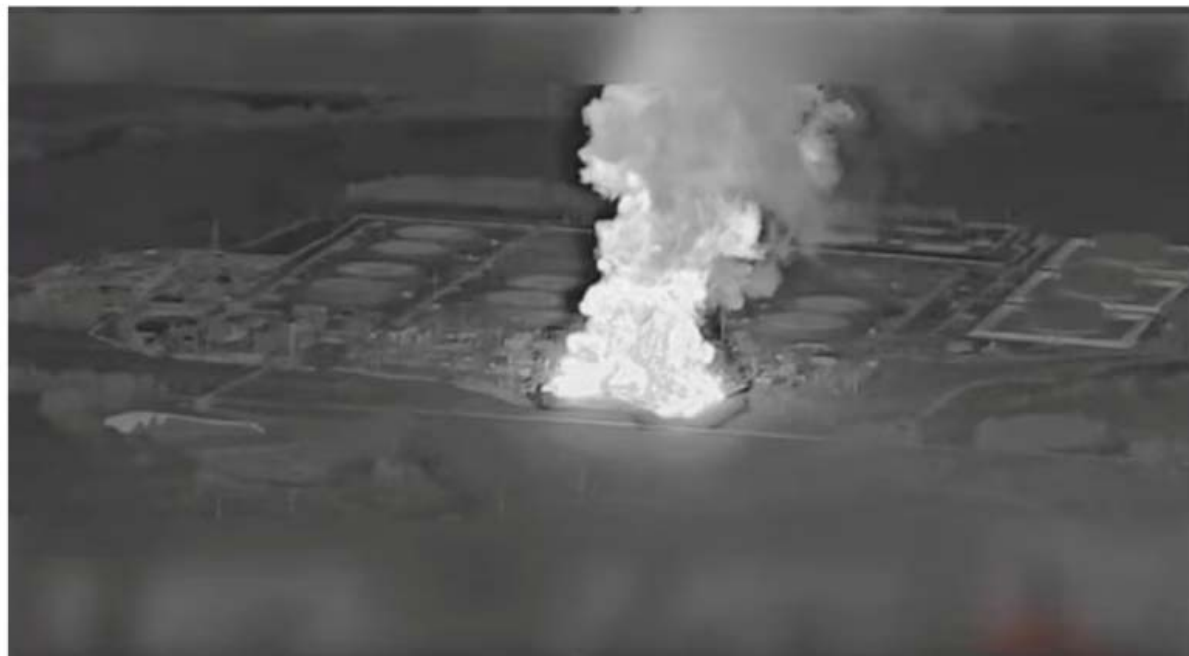
Smoke rises from the Unecha oil pumping station during a fire, in Unechsky district, Bryansk region, Russia, August 21, 2025 in this night vision still image obtained from social media video.

Les États-Unis mènent cette guerre contre la Russie. Pour ce faire, ils utilisent l'Ukraine et l'Europe. C'est la guerre de l'Amérique. Ce sont eux qui ont déclenché la guerre. Ce sont eux qui la mènent. Sans les États-Unis, la guerre ne pourrait pas continuer.