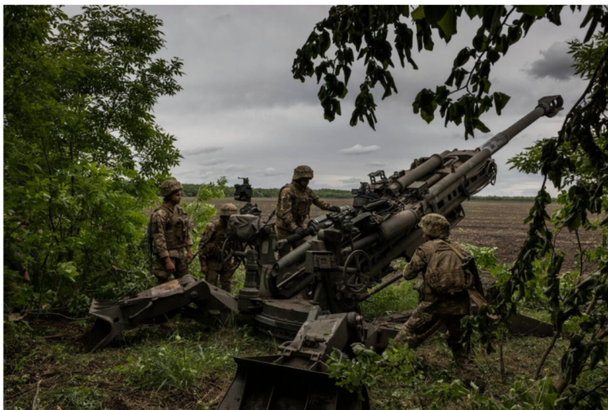
▲ Ukrainian soldiers prepare to fire an M777 howitzer at Russian forces in the Donetsk region. (Photo by The New York Times)

Agence de presse de la République islamique, 12 décembre 2025