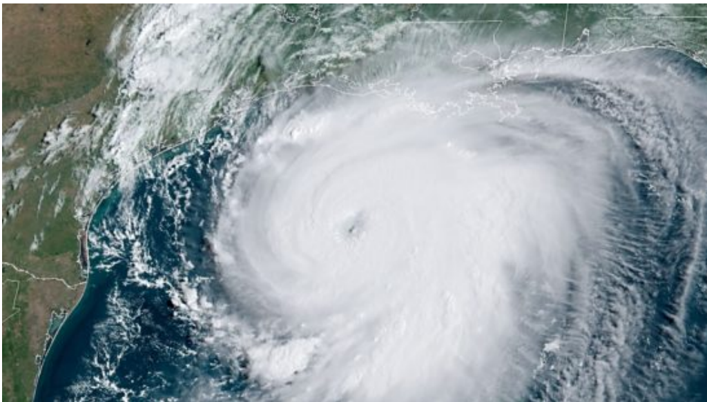
Fig. 1. Image GOES-East Geocolor du grand ouragan Laura se dirigeant vers la côte sud-ouest de la Louisiane à 9h50 HAC le 26 août 2020.

Il faut s'attendre à l'inévitable couverture de l'événement par les médias qui affirmeront faussement que les ouragans qui frappent les États-Unis augmentent, un sujet que j'ai abordé dans mon livre électronique « Pourquoi les ouragans ne peuvent pas être attribués au changement climatique ».