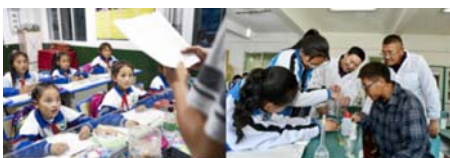
A gauche : Des élèves suivent un cours dans la ville de Qamdo de la région autonome du Tibet, le 14 septembre 2020. A droite : Un enseignant du Hubei et un enseignant local dirigent des élèves dans une expérience de chimie au lycée n° 1 de Shannan, dans la région autonome du Tibet, le 7 mai 2019.

A l'inverse, l'enseignement supérieur chinois est prioritairement axé sur le développement accéléré des sciences et techniques et est donc directement orienté vers l'effort de montée en gamme technologique tous azimuts du pays ! Pour la jeunesse chinoise fraîchement diplômée, l'incertitude du lendemain est aujourd'hui un sentiment inconnu. Quant aux étudiants et aux jeunes diplômés occidentaux, leur perspective générale se résume aujourd'hui en ces quelques mots : précarité et chômage croissants !