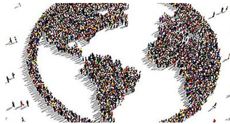
Le piège malthusien.

Leurs campagnes de stérilisation des pauvres n'ont pas tant diminué la population globale. On remplace cette stratégie compromettante par la promotion de la neutralité sexuelle. On encourage les jeunes à ne pas accepter de se reconnaître garçon ou fille. On promeut l'abstinence dans un couple. Les femmes et hommes qui s'affirment hétérosexuels et s'identifient à un sexe précis sont diffamés comme étant des réactionnaires rétrogrades. Ce sont eux, maintenant, qui souffrent de préjugés. Le but de ce mouvement n'est pas d'accorder une place juste aux homosexuels et aux transgenres, ce qui serait bon pour eux. Sous le travestissement d'une « société ouverte », le véritable projet vise à réduire la population. Autrefois, on avait besoin d'ouvriers et de paysans, pour fournir ce que l'élite nécessitait et ne daignait pas elle-même produire. Avec le transhumanisme et l'automatisation des tâches, l'élite financière n'a plus besoin d'autant de travailleurs. Il faut donc en éradiquer le plus possible, puisqu'il n'est pas question de payer pour leur entretien, une fois mis au chômage.