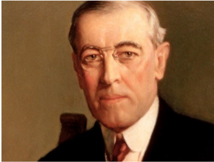
Le président démocrate, Woodrow Wilson (1913-1921), fut le concepteur de la Société des Nations, prédécesseur de l'Onu. Il favorisa le Klu Klux Klan au sein de son Parti et instaura la ségrégation raciale.