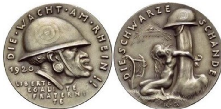
Médaille commémorative réalisée par Karl Goetz

Rappelons-nous que le racisme des années 1930 avait tous les attributs de la Science. Il faisait l'objet de recherches dans de nombreux instituts scientifiques et était enseigné dans des universités aussi bien aux États-Unis qu'en Europe occidentale. Pour préserver la race supérieure, de nombreux États « modernes » avaient interdit les mariages interraciaux avant la Première Guerre mondiale.