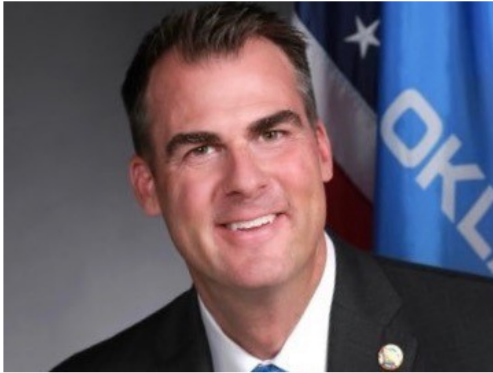
Le gouverneur Kevin Stitt mène la lutte contre l'institutionnalisation du racisme par l'administration Biden