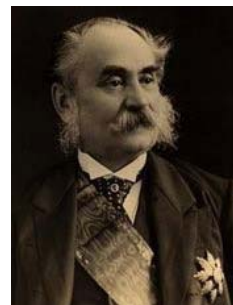
François Georges-Picot (1870-1951) a dessiné avec ses collègues de Whitehall la carte du Moyen-Orient actuel. Figure tutélaire du Parti colonial, il est le grand-oncle du président Valéry Giscard d'Estaing (1926-2020).

Le fond des contradictions de la politique étrangère française a été exprimé par l'ancien Président Valéry Giscard d'Estaing, dans Le Parisien du 27 septembre 2015 [10]. Apportant son soutien à son successeur de gauche, cet homme de droite déclare : « Je m'interroge sur la possibilité de créer un mandat de l'ONU sur la Syrie, pour une durée de cinq ans » ; une formule élégante pour réintroduire le mandat exercé par la France, avec l'aval de la Société des Nations, de 1920 à 1946. Le mandat était une expression politiquement correcte pour désigner la colonisation de la Syrie, telle que planifiée durant la Première Guerre mondiale par Sir Mark Sykes, François Georges-Picot et Sergueï Sazonov, représentant respectivement le Royaume-Uni, la France et l'Empire tsariste (les « accords Sykes-Picot »). Or, et ce n'est pas un hasard, Valéry Giscard d'Estaing est le petit-cousin germain de François Georges-Picot.